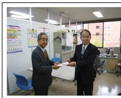
(社)福岡県青少年育成県民会議